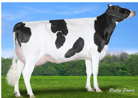
CLAYNOOK FIESTA MODESTY DAM